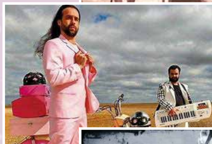
El Gran Rufus