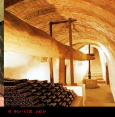
BODEGA OVIDIO GARCÍA