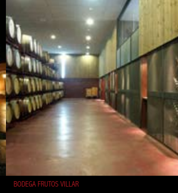
BODEGA FRUTOS VILLAR